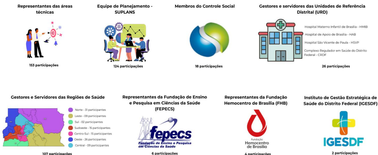
Figura 2: Participações nas Oficinas de Elaboração da PAS 2026.