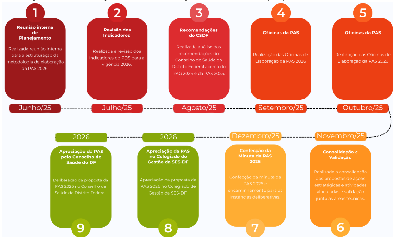
Figura 1: Trilha Metodológica de Elaboração da Programação Anual de Saúde (PAS) 2026.